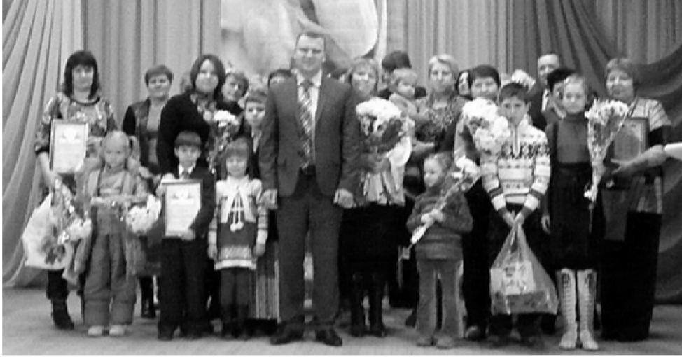
Мамы и их дети.